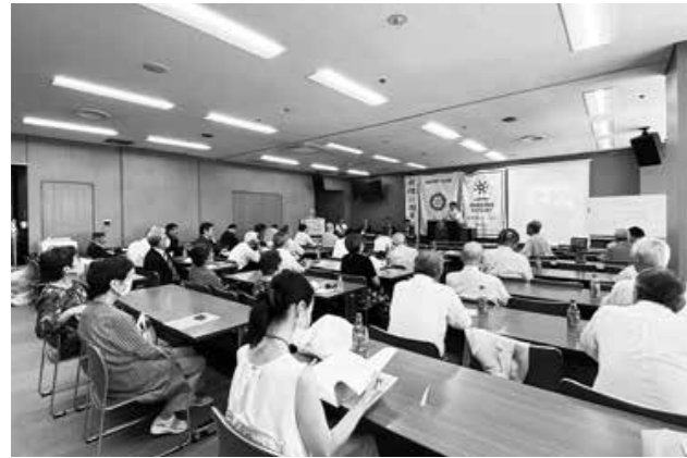
60周年記念事業等について、会員の皆様より意見・提案等があり、そちらについても議論されました。

本日はお時間をいただきまして、記念事業に対する決をとりていきたいと考えております。よろしくお願いいたします。