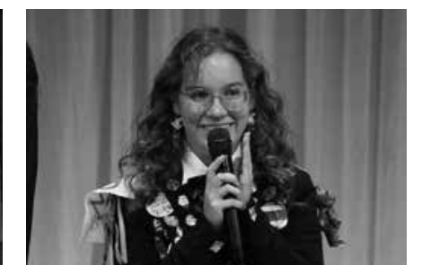
青少年・学友関連紹介 エマさん