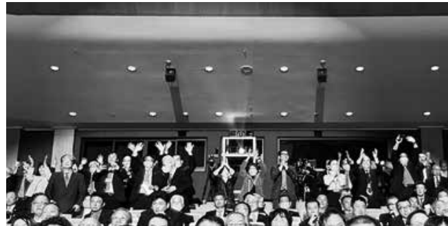
地区内クラブ・合同奉仕事業紹介